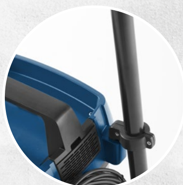
NUOVO SOSTEGNO ACCESSORI E CAVO

TRIPLO SISTEMA DI FILTRAZIONE SACCHETTO CARTA + FILTRO TELA O CARTUCCIA + FILTRO D'ARIA IN USCITA