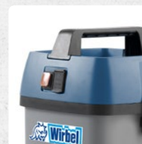
POSSIBILITÀ DI COLLEGAMENTO DELL'ELETTRO- SPAZZOLA