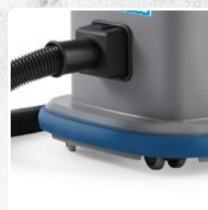
PARACOLPI IN GOMMA ANTISTRACCIA