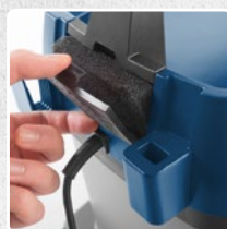
SISTEMA DI FILTRAGGIO ARIA DI SCARICO