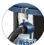
Attacco tubo rapido