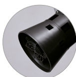
Cestello tendifiltro con galleggiante