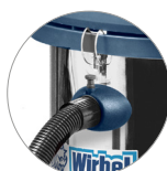
Attacco tubo rapido