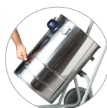
Sistema basculante: svuotamento fusto facilitato