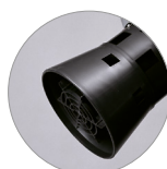
Cestello tendifiltro con galleggiante