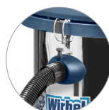
Attacco tubo rapido