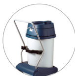
Sistema basculante: svuotamento fusto facilitato