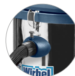
Attacco tubo rapido