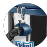
Attacco tubo rapido