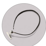
Kit antistatico (IK)