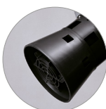
Cestello tendifiltro con galleggiante