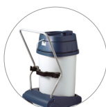
Sistema basculante: svuotamento fusto facilitato