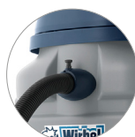
Ataque rápido de la tubería