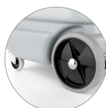
Ruedas delanteras giratorias y ruedas de gran diámetro