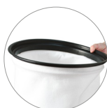
Filtro de tela