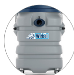
Depósito de plástico resistente a los impactos