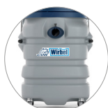
Fusto in plastica antiurto ultra resistente