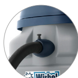
Attacco tubo rapido