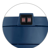
Pulsanti di azionamento motori