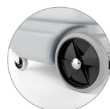
Schwenkräder und räder hinten mit großem Durchmesser