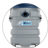
Behälter aus extrem widerstandsfähigem und schlagfestem Kunststoff