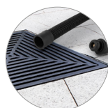
Tubo di scarico