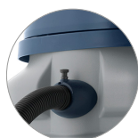
Attacco tubo rapido