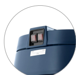
Pulsanti di azionamento 3 motori