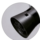
Cestello tendifiltro con galleggiante