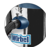
Attacco tubo rapido