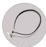
Dispositivo antiestático (IK)