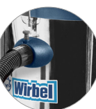
Ataque rápido de la tubería