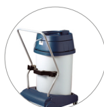
Depósito con sistema basculante: vaciado facilitado