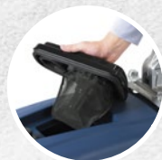
Tapa + flotador + filtro