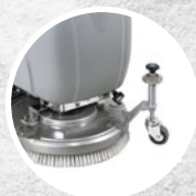
Ruedecilla externa para la regulación del cabezal en altura

Hybrid: el sistema innovador que asocia la alimentación eléctrica con la de batería (baterías de litio, hasta dos horas de autonomía y una hora de carga aproximadamente), capaz de garantizar la perfecta mezcla entre rendimiento, autonomía de uso y sesiones de trabajo prolongadas.