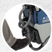
Sistema de elevación del secador con pedal