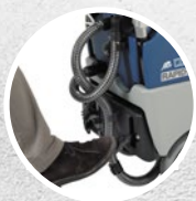
Sistema de elevación del secador con pedal