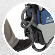
Sollevamento tergitori a pedale