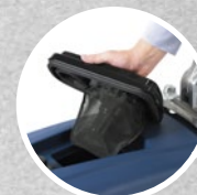
Coperchio removibile + galleggiante + filtro