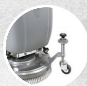
Ruotino esterno, regolazione in altezza