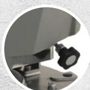
Manopola frontale, regolazione angolo testata