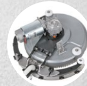
Tergitore e rotazione (fino a 270°)