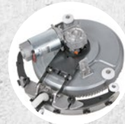
Tergitore e rotazione (fino a 270°)