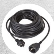
Cavo da 15 m