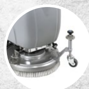
Ruotino esterno, regolazione in altezza

Hybrid: il sistema innovativo che associa l'alimentazione elettrica a quella a batteria (batterie al litio, fino a due ore di autonomia e un'ora circa di ricarica) in grado di garantire il perfetto mix tra performance, autonomia di utilizzo e sessioni di lavoro prolungate.