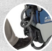
Sollevamento tergitore a pedale