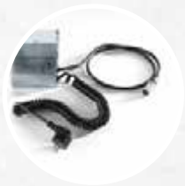
LADEGERÄT 24V 10 A cod. 22.0619.01