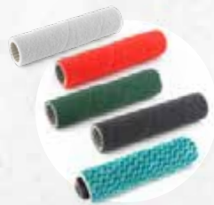
ZYLINDRISCHE PADS WEISSE cod. 40.5000.11 ROT cod. 40.5000.12 GRÜN cod. 40.5000.13 SCHWARZ cod. 40.5000.14 AUS MIKROFASER cod. 40.5000.04**