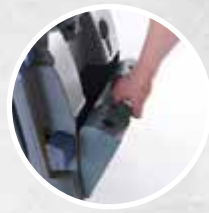
KOFFER FÜR BATTERIEN LITHIUM 24V 560 WH (Ausführungen 20 Ah) cod. 22.0571.01