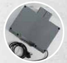
SATZ KOFFER MIT ELEKTRISCHEM LADEGERÄT 230 V Damit können auch die batteriebetriebenen Modelle M33 in Modelle mit Stromkabel verwandelt werden. (mitgeliefertes für ausführungen E) cod. 22.0509.00