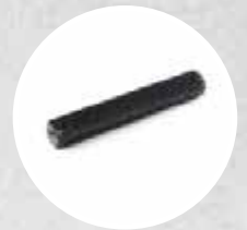
ZYLINDRISCHE PADS TREIBTELLER cod. 40.5000.06