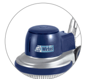
Neue Kunststoff- Abdeckung (L22)