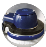
Posibilidad de uso peso adicional