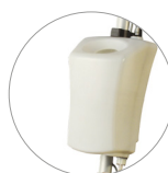
Depósito de 12 l