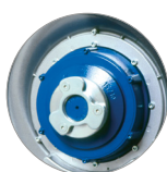
Attacco disco trascinatore e spazzole