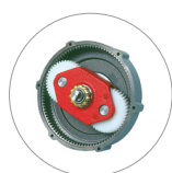
Riduttore a satelliti e planetario