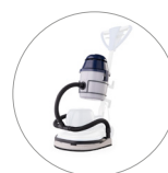
Gruppo aspirante (optional)