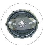
Riduttore a satelliti e planetario (L22)