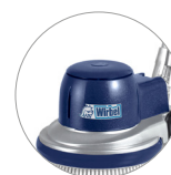
Nuova cover in plastica (L22)