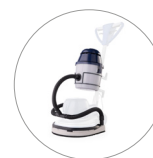
Gruppo aspirante (optional)