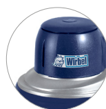
Nuova cover in plastica (M22)