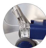
Snodo del manico