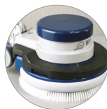
Möglichkeiten Zusätzliches Gewicht (optional)