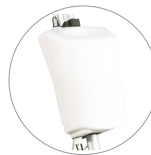
Reinigungsmitteltank 12 l (optional)