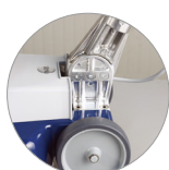
Snodo del manico