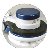
Possibilità uso peso aggiuntivo