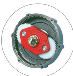
Riduttore a satelliti e planetario