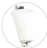
Serbatoio 12 l (optional)