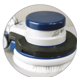
Possibilità uso peso aggiuntivo (optional)