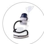
Gruppo aspirante (optional)