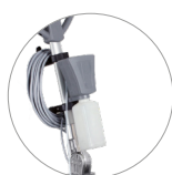
Spray electric system