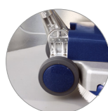
Snodo del manico