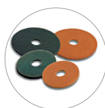
Vari tipi di pad