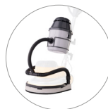
Gruppo aspirante (optional)