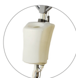
Depósito de 12 l