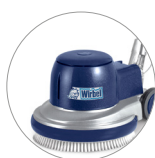
Nueva cubierta de plástico (L22)