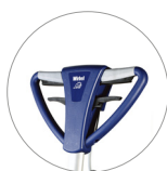
Empuñadura (vista frontal)