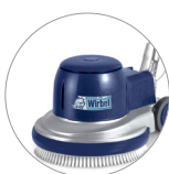
Nuova cover in plastica (L22)