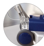
Snodo del manico