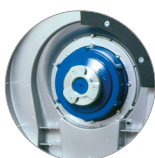
Attacco disco trascinatore e spazzole