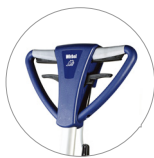
Impugnatura vista fronte