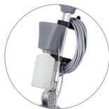
Elektrisches Spray-System (optional)