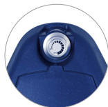
Einstellung des Bürstendrucks