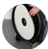
Sistema de pad flotante único