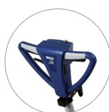
Empuñadura (vista frontal)