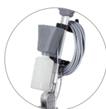
Sistema de pulverización eléctrico