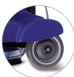
Ruedas no deja huella