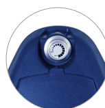
Perilla de ajuste de la presión del cepillo