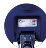
Luz de advertencia