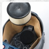
MOTORSCHUTZFILTER + PATRONENFILTER HEPA