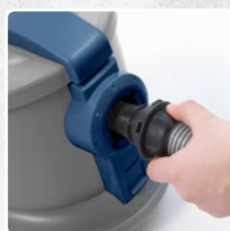
BAJO- NETT-SCHLAUCH- ANSCHLUSS