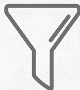
DREIFACHES FILTERSYSTEM PAPIERBEUTEL + STOFFBEUTEL ODER PATRONE + LUFTFILTER AM AUSGANG