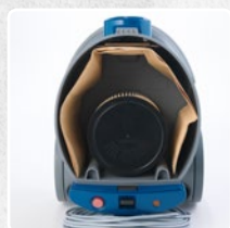
BEHÄLTER MIT GROSSEM FAS- SUNGSVERMÖGEN