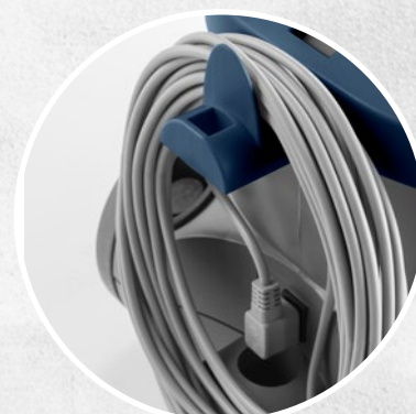
ABNEHMBARES KABEL VON 15 METER (STANDARD AUSSTATTUNG)