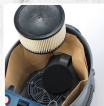
FILTRO PROTEZIONE MOTORE + FILTRO A CARTUCCIA HEPA