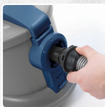
INNESTO TUBO A BAIONETTA