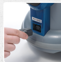
PRESA PER ELETTROSPAZZOLA