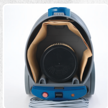
VANO INTERNO DI GRANDI DIMENSIONI