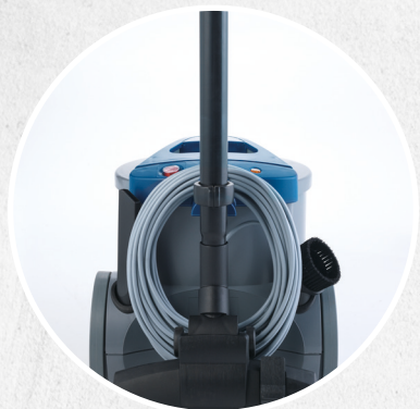
ATTACCHI TUBO POSTERIORE