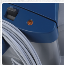
SPIA RIEMPIMENTO SACCHETTO