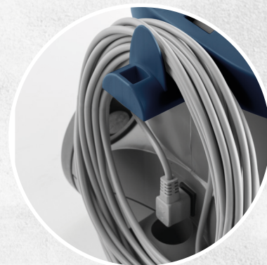
CAVO SGANCIABILE DA 15 METRI (IN DOTAZIONE STANDARD)