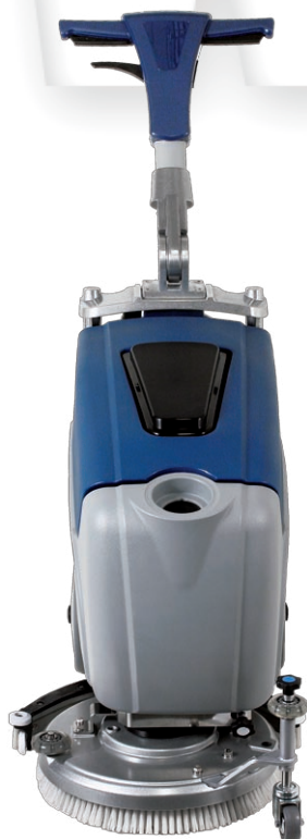
Design moderno, dimensioni ultra compatte

La migliore soluzione per superfici medio piccole