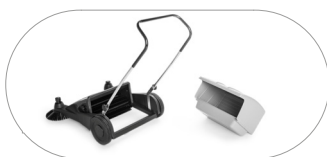
Contenedor de residuos de gran capacidad