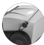
Sistema de bloqueo de la manija práctico y rápido