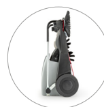
Dimensiones compactas: fácil de guardar