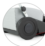
Ruedas posteriores de gran diámetro