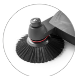
Spazzole laterali regolabili in altezza