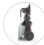
Dimensioni compatte: facile da riporre