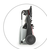
Dimensioni compatte: facile da riporre