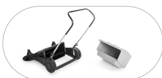
Contenitore rifiuti di grande capacità