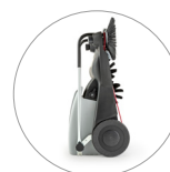
Dimensioni compatte: facile da riporre