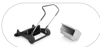
Contenitore rifiuti di grande capacità