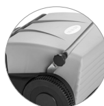
Sistema di bloccaggio del manico pratico e veloce