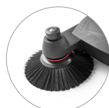
Spazzole laterali regolabili in altezza