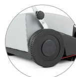
Grandi ruote posteriori