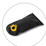
Filtro a rete per lo sporco grossolano