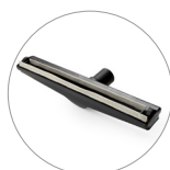
Bocchetta pavimenti liquidi con ruote laterali