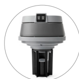
Sistema galleggiante + pulsanti azionamento due motori