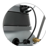
Spina di alimentazione pompa di evacuazione