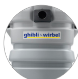
Fusto in plastica antiurto ultra resistente