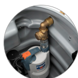
Pompa di evacuazione integrata con sgancio rapido