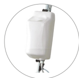
Depósito de 9 l