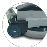
Articulación de la palanca