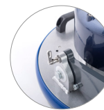
System für die blockierung des kopfes