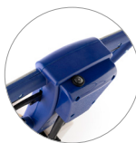
ON/OFF-Taste auf dem Griff zur Aktivierung des Spray Systems