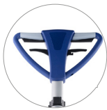
Empuñadura (vista frontal)