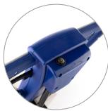
Botón ON-OFF en el mango para accionar el sistema pulverizador