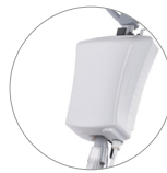
Depósito de 12 l