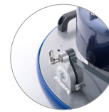
Sistema de bloqueo de cabezal