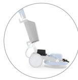
Spray system (depósito de 12 l, bomba CEME y boquillas regulables)