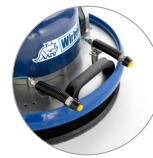
Dos boquillas regulables