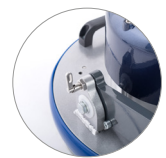
Sistema bloccaggio testata