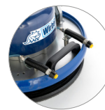
Due ugelli regolabili