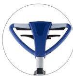
Impugnatura vista fronte