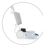
Spray system (serbatoio 12 l, pompa CEME e ugelli regolabili)