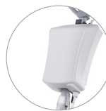
Serbatoio 12 litri