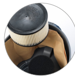
Filtro protezione motore + filtro a cartuccia