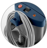
Cavo sganciabile da 15 metri