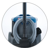
Attacchi tubo posteriore