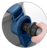
Innesto tubo a baionetta