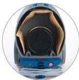
Vano interno di grandi dimensioni