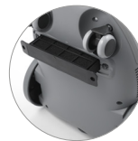
Filtro reimmissione aria