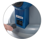
Presca per elettrospazzola