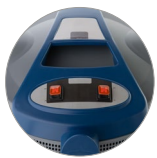
Einschalter (zwei motoren)