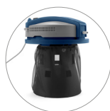
Filtro di protezione nylon