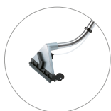
Bocchetta pavimenti alluminio (optional)