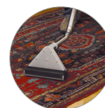
Ideal para todo tipo de superficies