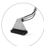
Boquilla para suelos