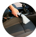
Comodidad y facilidad de uso