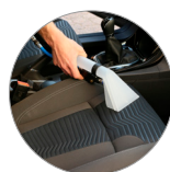
Komfort und einfache Bedienung