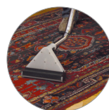
Ideal für jede Oberfläche