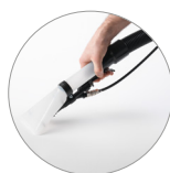
Boquilla manual pulverización (estándar para versión Auto)