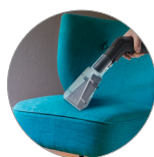
Ideal para todo tipo de superficies