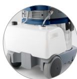
Tanque solución de limpieza extraíble