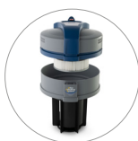
Ultra FilteRing System