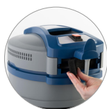
Prese ingresso e uscita aria raffreddamento motore