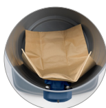
Sacchetto carta (optional)