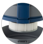
Filtro cartuccia in PTFE (classe M) sempre installato