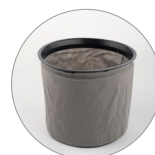
Vliesfilter (Polyester) waschbar (opt.)