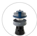
Ultra FilteRing System