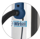
Robuster und langlebige Behälter aus Stahl