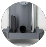
Kabelhalterung und zubehör holder