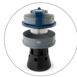
Ultra FilteRing System