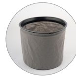
Vliesfilter (Polyester) waschbar (opt.)